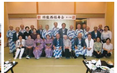
《5月は東一地区です》