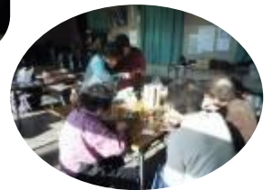
小物作り～在宅高齢者訪問～