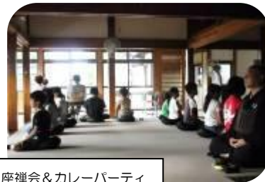
座禅会&カレーパーティ