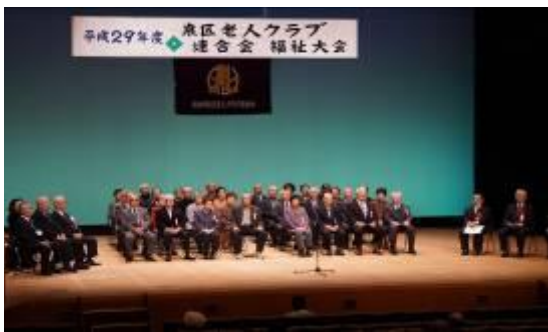
福祉大会：表彰者の皆さん

11/5: 仙台市介護予防月間「元気力アップフェスティバル」～仙老連・区老連・地区老連・単老の活動を紹介し、会員増強に努めた