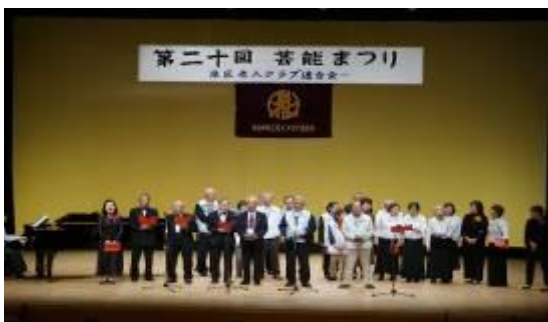
芸能まつり：全員合唱